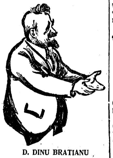
D. DINU BRĂTIANU

Lămuriri amănunțite în această chestiune a expertizilor, d. ministru Brătianu va da opiniei publice, după ce va expune guvernului asigurările