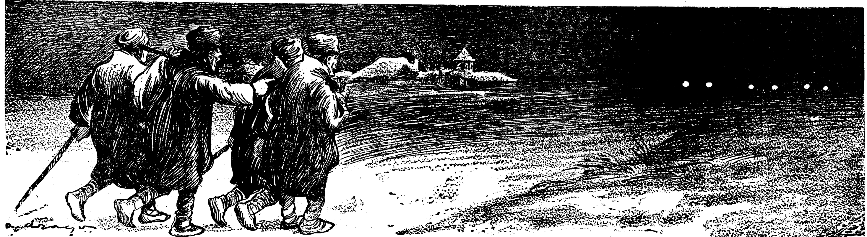
— Lupii, mă! — Mai rău, fraților! Niste automobile cu candidati!..