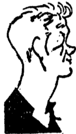
PALMER II (Juventus)