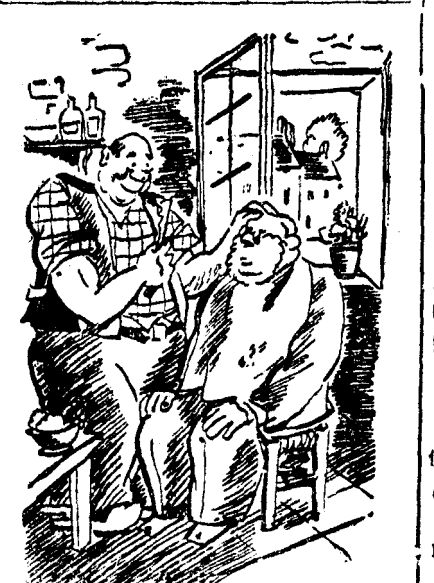
— E un bănuț de ras, că face mult câmbuc și se disolvă repede! — Cred și eu!... Mi l-a vândut un deputat național-tărănist...

IASI, 18. — Un grup de studenți a manifestat astăzi seară pe str. I. Șepșeanu.