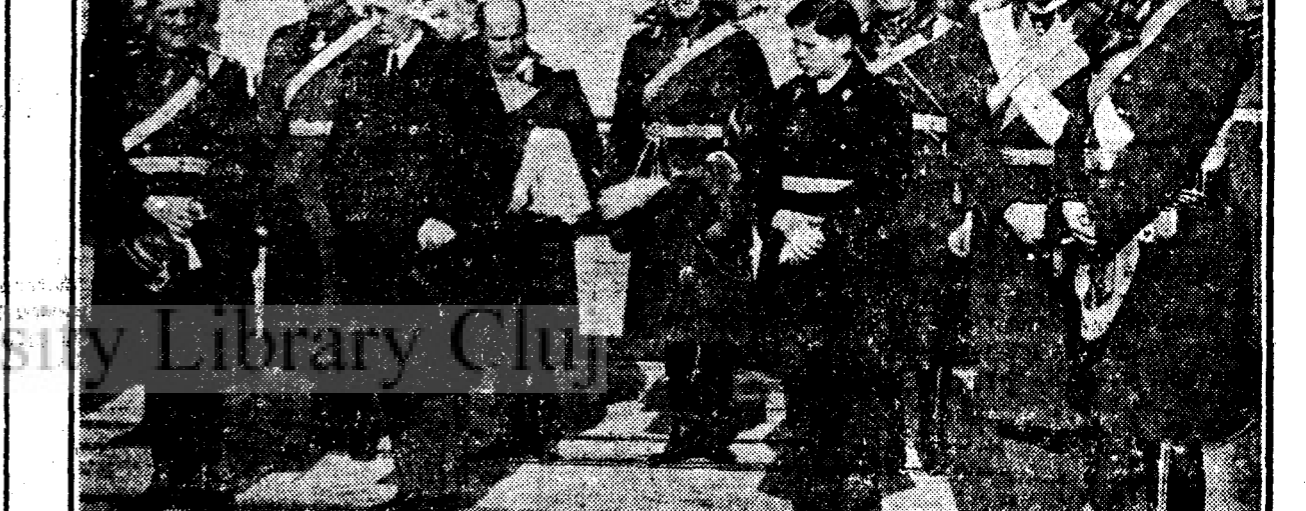
Suveranul și Principele Nicolae asistă la festivitatea