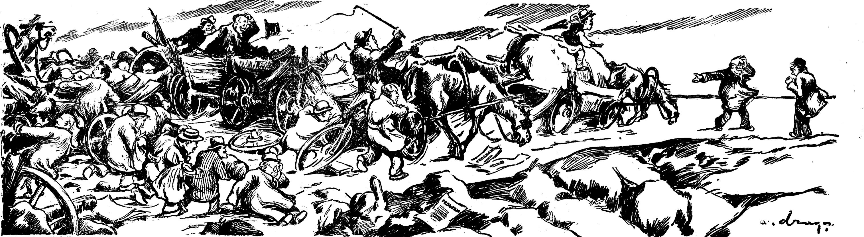
Vremuri de bejenie...