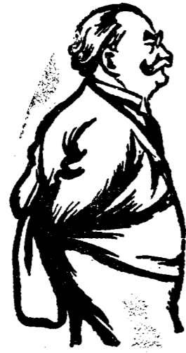
D. AL. VAIDA VOEVOD

Disciplinată și hotărâtă a face zid în jurul băncii ministeriale? Frământările intestinale ce-au ajuns de o intensitate necunoscută încă și slavă Domnului istoricului partidului național-tărănesc este mai mult pavestea unor necentenite irământări interne — în urma ațtitudinii dubioase pe care o are d. Iuliu Maniu în retragerea dela Bădăcin, sunt departe de a se dovedi. Dimpotrivă „maniştili” anunță