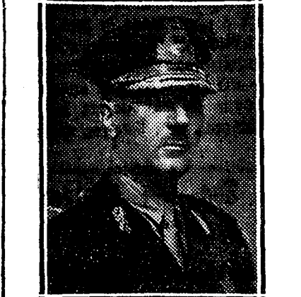
D. GENERAL V. BĂDULESCU

Duminică dimineața s'au inaugurat la O. N. E. F. cursurile celor două institute de educație fizică și anume Institutul superior de educație fizică (I. S. E. F.); Institutul militar de educație fizică (I. M. E. F.). La această solemnitate au luat parte domni: