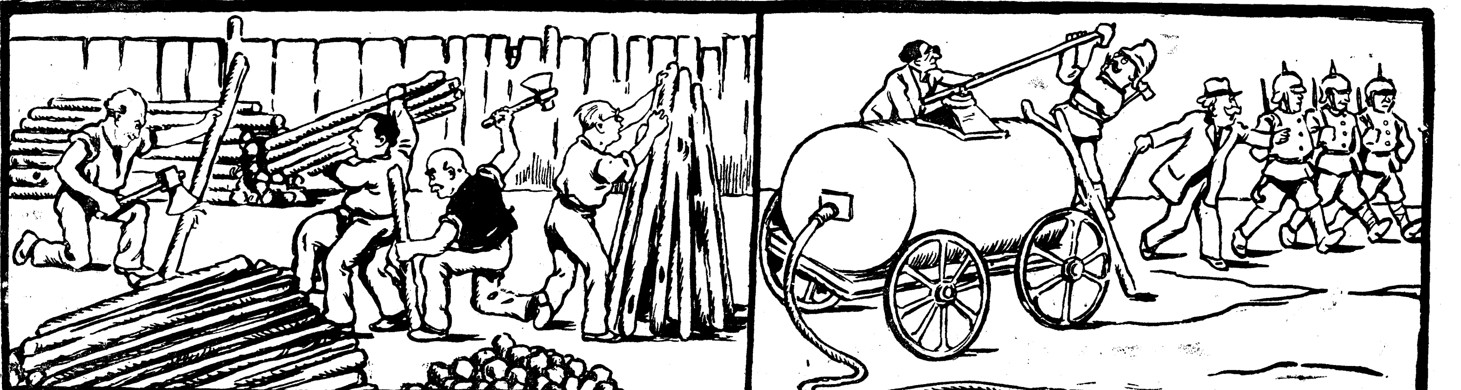
Pregătiri în vederea deschiderii sesiunii parlamentare