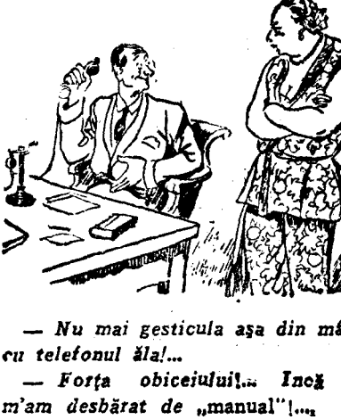
— Nu mai gesticula așa din mână, cu telefonul ăla... — Forța obiceiului... Încă nu m'am desbărat de „manual”...

An.III, No. 125 cu următorul sumar: CAND REGII SE ÎNTALNESC Ecouri dela Glurgiu și Ruschuk „Cămășile” fără halat și fără papuci JALNICA TRAGEDIA A SUPLINITORULUI ROMAN Caravana foot-baliștilor români la Berna Hitlerismul în anecdotă Câteva anecdote... neariene Redactori: Victor Rodan, Tudor Șolmar, L. G. Logreț 12 pagini ilustrate de A. Dragoș și I. Val. 2 lei