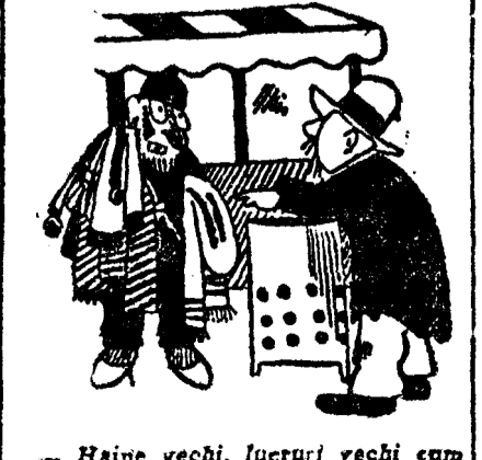
Haine vechi, lucruri vechi cum părăsim... Dă o raită pe la cluburile partidelor, că au ele niște programe de guvernământ cum își trebuie Dumitale!