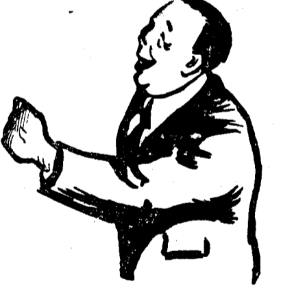
D. N. TITULESCU

După o scurtă plimbare prin oraș, d-sa s'a înnoptat la gară la ora 11.10 dim.