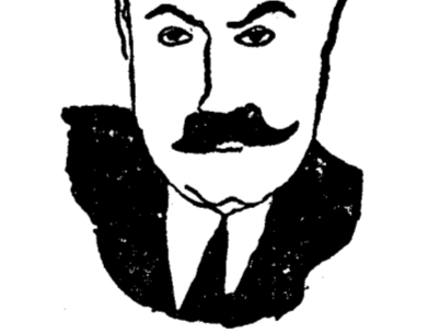
D. HENRY DE JOUVENEL

PARIS. 17 (Radior). — D. Henry de Jouvenel, senator și fost ambasador al Franței la Roma, a ținut azi un important discurs la banchetul a-