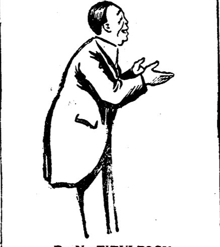
D. N. TITULESCU

LOCALI, 1. — În cercările politice din Iași se afirmă că demersul d-lui V. Săssu pe lângă d. George Brătianu este considerat ca un ultimatum adresat de partidul d-lui Duca, d-lui Brătianu ca să revie cu organizația sa în partid. Cum d. G. Brătianu a refuzat acest lucru, duștii cred că succesiunea o vor avea singuri. Un frunțos ducist din Iași declară că a primit o scrisoare dela d. Iaman-