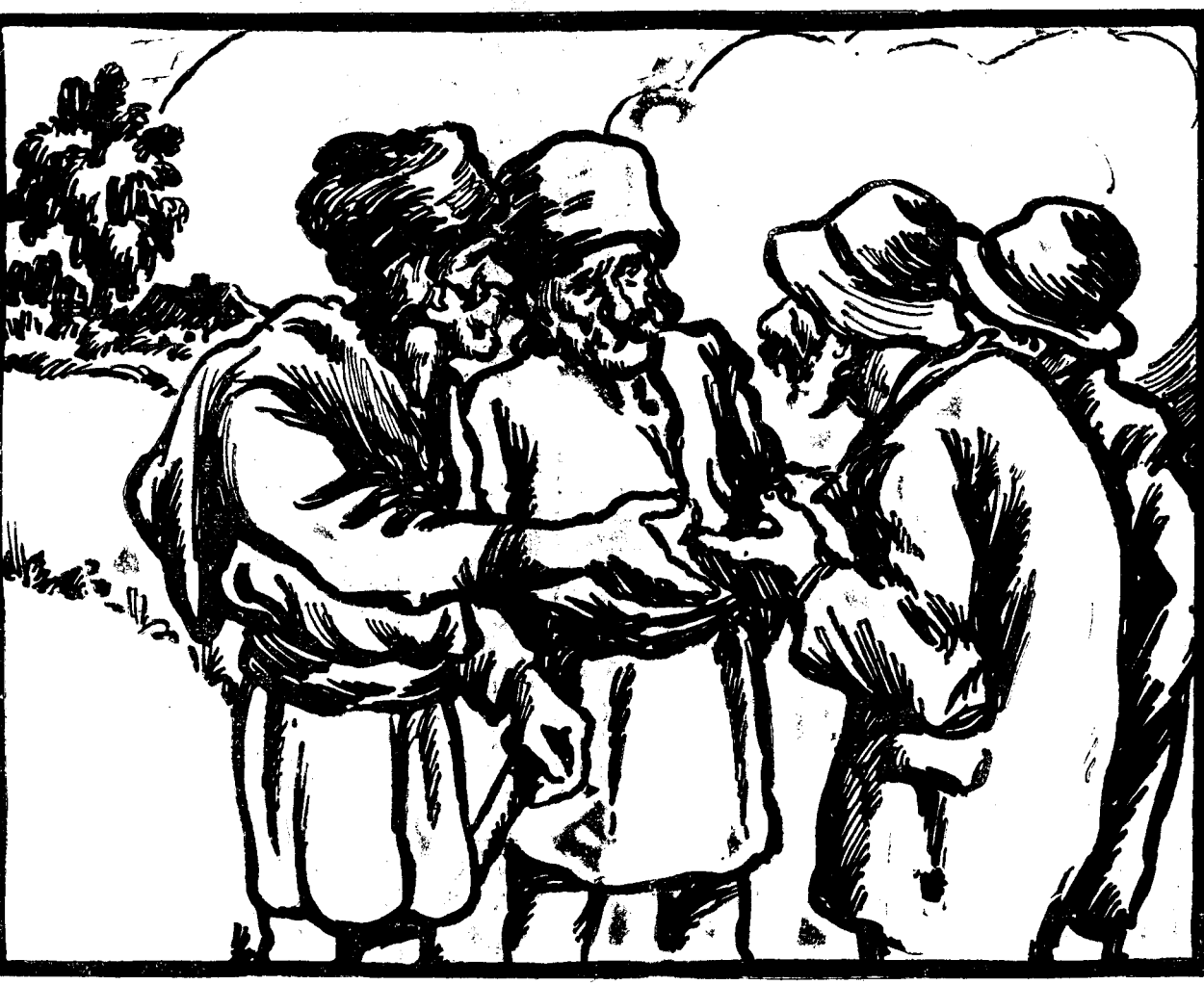
— Ai auzit, bade? A fost un deputat prin sat să întrebe de nevoile noastre... — Aoleu, bade! Atunci să știi că cade guvernul!..