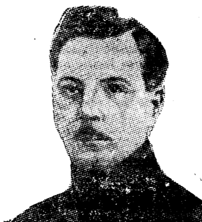
Un portret al lui Vorosilov.

Din Karbin se anunță, că în timp ce Vorosilov, comisarul apărării naționale,