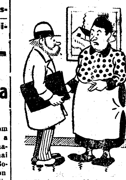
Veniseam cu chitanța, pentru consumația de gaz.