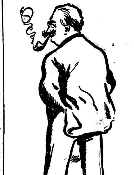
D. AL. VAIDA-VOEVOD

In cursul nopții am reușit să aflăm că în adevăr conform legii starea de asediu a încetat de a mai funcționa.