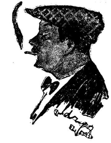
D. GR. FILIPESCU

Cuvântarea d-lui Grigore Filipescu Partidul conservator a ținut ieri dimineață în orașul Oltenița o intrunire publică de plasă. A prezidat pr. SACHELARIU, șeful plășii Oltenița. D. general CANTACUZINO GRANICERUL, a expus programul partidului. D. GR. FILIPESCU, a spus următoarele: Ceea ce desprinde din întreaga viață politică a noastră este războiul, e o mare minciună. Partidul Conservator a deschis lupta împotriva acestei minciuni. În ce privește lichidarea datoriilor, înțelegem ca prim-o politică chibzută să atragem 5—6 miliarde de lei capital străin. Printr-un moratoriu de 1 an-doi, debitorii să se înțeleagă cu creditorii, reducându-li-se datoriile, iar restul să fie plătit în numerar din imprumut extern, astfel ca creditul să poată fi înținat mai departe. Pentru valorificarea cerealelor se cer îarși capitaluri, dar de aceea ele nu trebuie să fie descutate de inflație. Viața s'ar scumpi, alungându-se nesurterit. Noi nu putem da leacuri de scaunatori. Știu un lucru, că țara ne va cădea într-o zi și o salvăm. Numai să nu ne cheme prea târziu. Nu alergăm după voturi cu prețul minciunii. Socotim că și această țară are nevoie de un pic de adevăr. Dela noi îl va auzi todeauna.