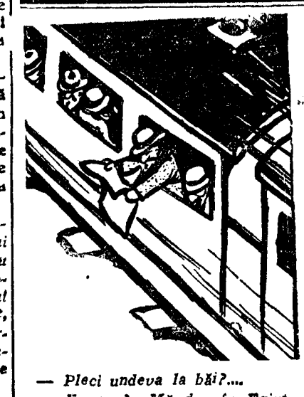
— Peeciu unde la băi?... — Eeeuuu?... Mă duc în Egipt, să măi scap de doli!!