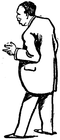
D. N. TITULESCU

Acest document reprezintă un început fericit pentru formarea blocului Europei Orientale și pentru consolidarea păcii nu numai în Europa de Est, ci în toată Europa.