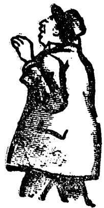
D. OCTAVIAN GOGA

Acum tendința mea este de a strivi galeria celor ce prin mine au ajuns să stăpânească țara, nu pentru a mă ridica pe ruinele lor ci pentru a crea acestui neam o speranță nouă prin dezmățarea. Suntem chemați pentru ca să for-