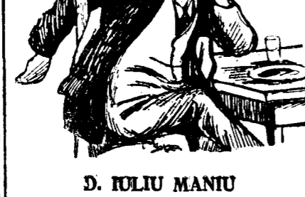
D. IULIU MANIU

ocupat de soluțiile cele mai juste ce s'ar putea da problemelor economice la ordinea zilei. Părerile ce le are le împărtășește intimilor d-sale cari la rândul lor aștează după prozele... economice.