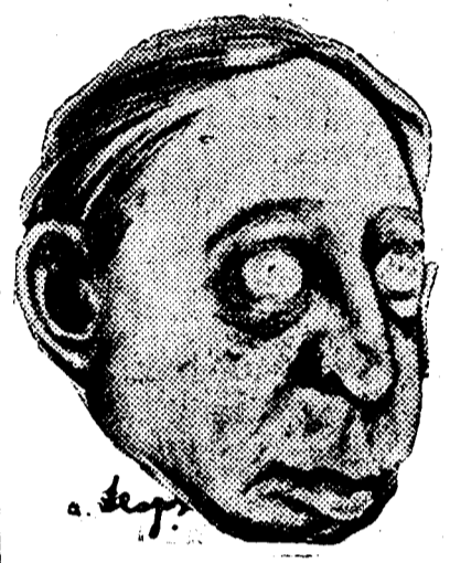
D. OCTAVIAN GOGA