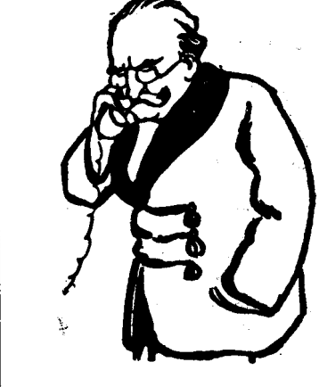
D. AL. VAÍDA

Un singur lucru se poate spune cu siguranță că în situația actuală, arbitru este numai d. Vaída.