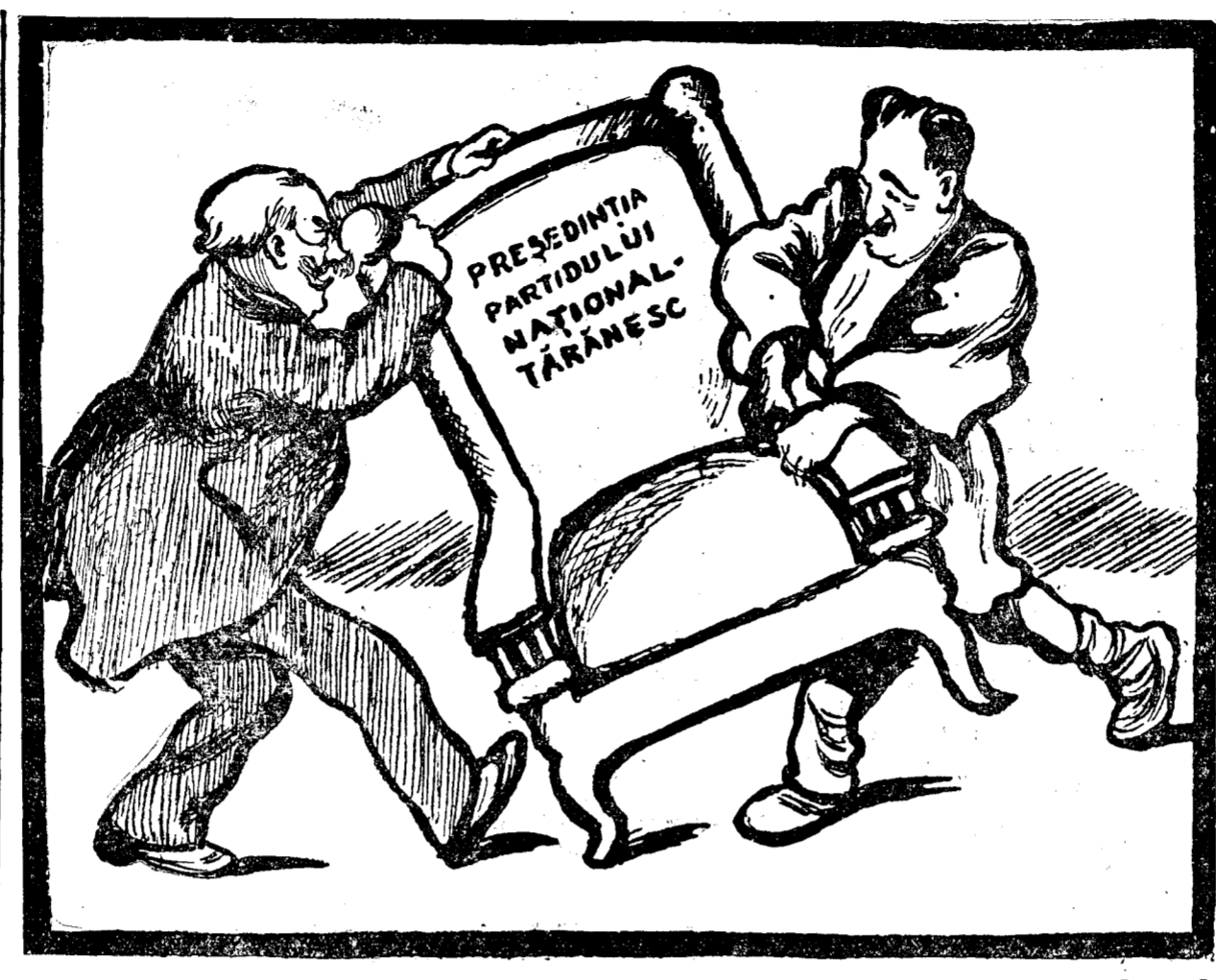
„D. Vaida se dezinteresează complet de demisia d-lui Maniu, iar d. Mihailache o lasă spre rezolvarea forurilor statutare ale partidului.” Ziarele

Mari inundații la Iași, la Huși, la Bălău, Bălău din nou sub apă, și din nou Tg. Frumos, Podul-Ilcoi, o sumă de sate din Roman, Vaslui, Bacău, din celălalt capăt al țării, la Lipova, Radna, Șoimii, Recea și Remetea țimeșană, din nou circulația trenurilor întreprinsă și din nou călătorii și mărfurile trimise pe rute ocolite. Din nou semănăturile de toamnă și arăturile de primăvară acoperite cu un strat gros de măt și din nou apelurile pentru ajutorarea sinistrăților.