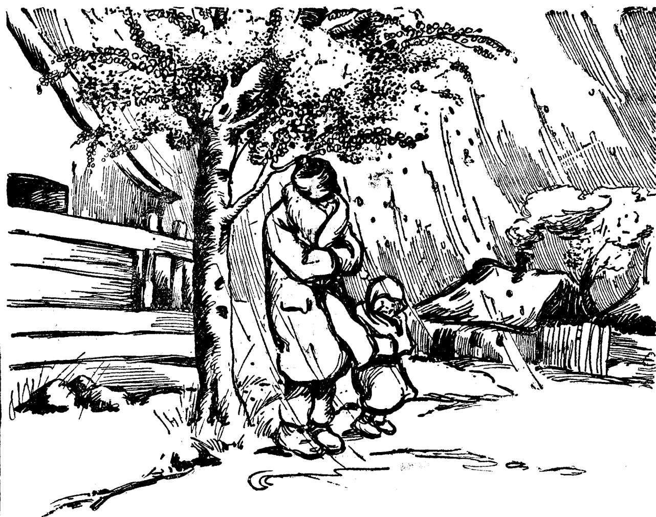
PRIMAVARA 1933 „...Pe sub cuișul înflorit...”