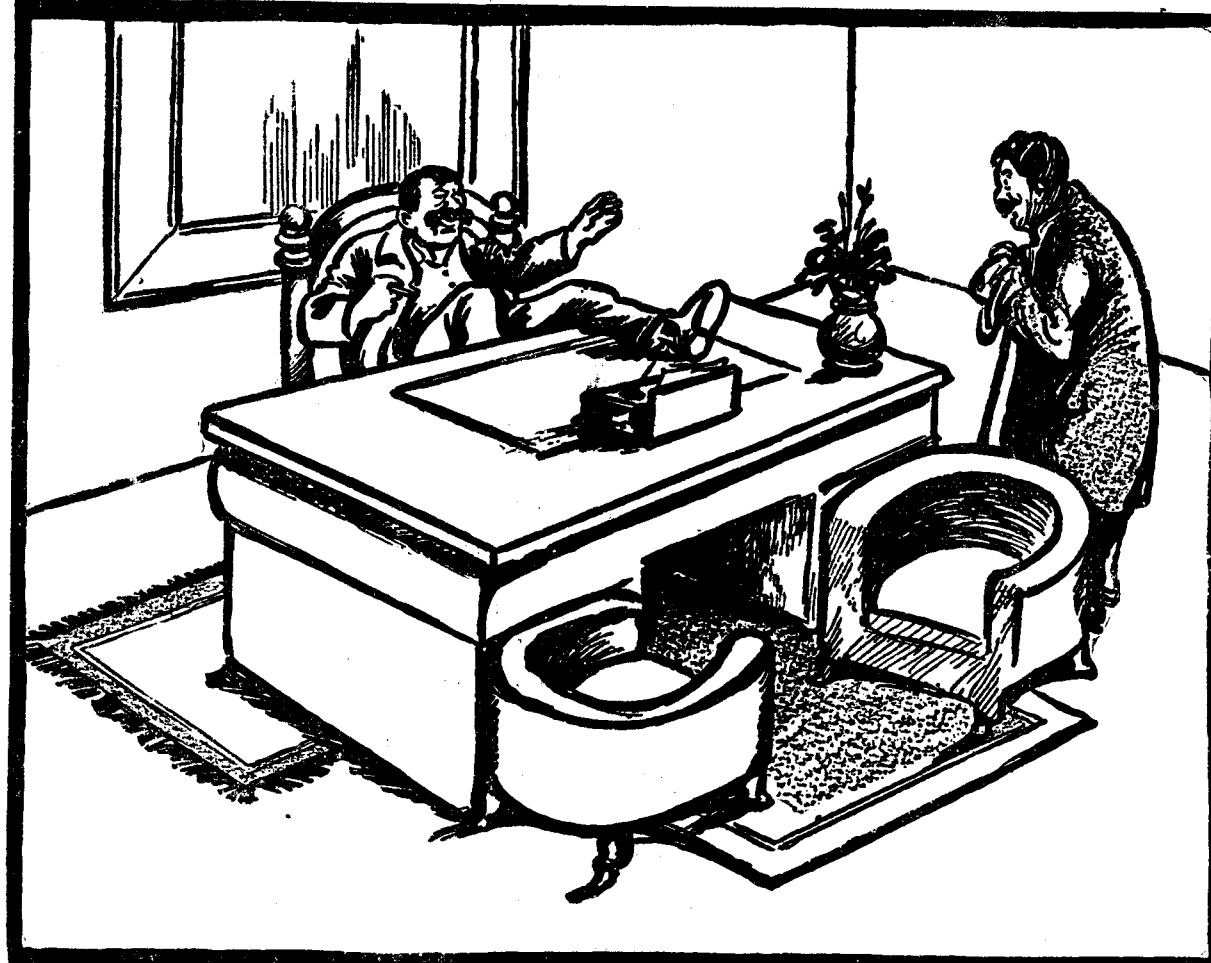
— Domnul ministru a venit? — Nu, și nici nu vine. E mahmur dela consiliul de miniștri de azi noapte. Cică au întins-o până la 3 dimineața...