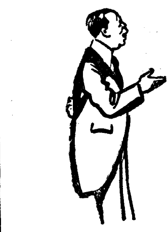
D. N. TITULESCU

GENEVA, 14. (Rador). — Co-responsabilul din Geneva al agenției „Rador” comunică următoarele: Cel trei miniștri ai Micii Înțelegeri s'au întrunit astăzi la locuința d-lui Titulescu, ministrul de externe al României. Conform hotărârilor luate la Belgrad, discuțiile celor trei miniștri ai Micii Înțelegeri au purtat asupra elaborării unui „pact de organizație al Micii Înțelegeri”, care să-i permită a acționa ca un organism internațional unificat. Partea politică a noului pact a fost definitiv redactată. Discuția asupra părții economice va continua în cursul serii și mâine dimineață. Mâine se va publica un comunicat asupra concluziunilor la care cei trei miniștri ai Micii Înțelegeri se vor fi oprit. PARIS, 14 (Rador) — Agenția „Havas” anunță din Geneva: D. Paul Boncour, a avut azi o întrevedere cu d-nii Titulescu, Benes și Jeitlic, miniștrii de Externe ai statelor Micii Înțelegeri. D. Boncour va pleca mâine la Paris, rămânând ca la lucrările conferinței dezarmării să fie înlocuit de d. Cot, ministrul Aerului.