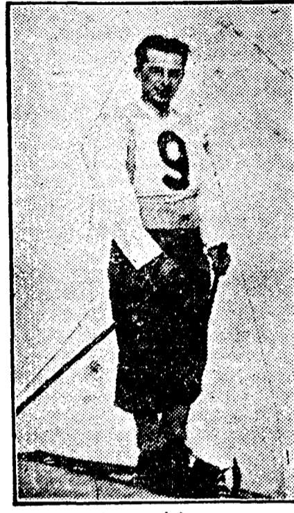
LEXEN, echipier român

Inscrierea României a fost bine primită cu atât mai mult că lista remisă cuprinde elemente de o valoare egală celorlalți reprezentanți ai Federațiunilor participante — asigurând astfel probelor, interesul scontat.