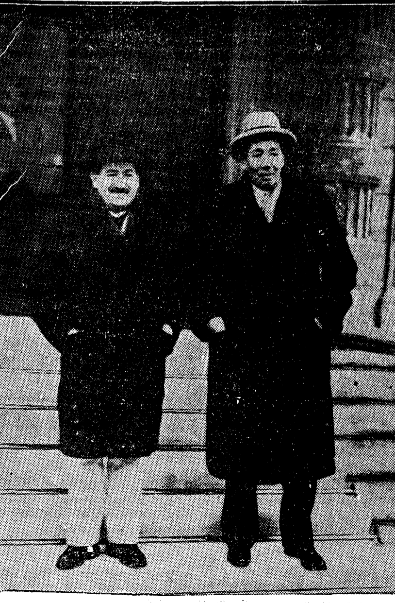
D-NII MIHALACHE ȘI TITULESCU EȘIND DELA PALAT

Retragerea d-lui Titulescu din diplomație a provocat vii discuții și a dat loc la interpretări diferite in cercurile politice. Am căutat să găsim și noi explicația acestei retrageri neașteptate, firește, pentru aceasta, adresându-ne cercurilor titulescane. In aceste cercuri, ni s'a arătat că d. Titulescu s'a retras din diplomație nu cu intenția ca, in viitor, să facă politică internă activă. D. Titulescu a părăsit Legația dela Londra pentru a răspunde unei invitații și des repetate sugestii care, uneori, s'a dovedit a fi și dorința unora dintre partidele politice: acela ca, d-șă, să-și asume pentru un timp cât mai îndelungat posibil răspunderea conducerii politicii noastre externe. Acest lucru d. Titulescu nu-l poate face, in bune condițiuni, dela Londra. Fapt ce i s'a și reproșat, de altfel, deseori. Acastă explicație ar justifica prezența d-sale in guvernul Vaida, ce se pregătește.