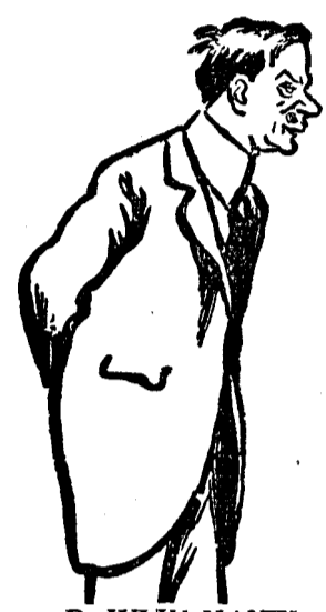
D. IULIU MANIU