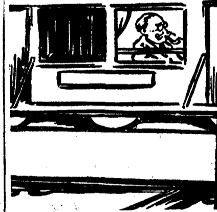
D. AL. VAIDA VOEVOD

La orele 11 jum. d. Maniu a mai avut in locuința d-sale o scurtă ședință cu membrii biroului național-tărănesc, iar la orele 12 a sosit la Palatul Regal, unde a fost imediat primit in audiență de Rege. Audiența a durat 20 minute, după care d. Maniu s'a îndreptat spre locuința d-sale. Aici d-șă a declarat ziaristilor că in întvederea avută cu M. S. Regele a rămas stabilit să fie din nou chemat in audiență după amiază. După audiența d. Maniu s'a consultat din nou cu membrii biroului care se aflau la locuința d-sale, iar după aceea a luat masa împreună cu d. Mihălache, la d. Mihălache acasă. La orele două, biroul național-tărănesc s'a întrunit din nou, ținând ședință până la orele patru fără un ștort, când d. Iuliu Maniu, a plecat pentru a doua oră la Palatul Regal.