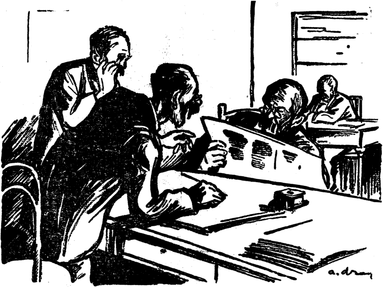
— Cât crezi că o să fie criza? — O lună cel puțin. O săptămână a fost numai până ce s'a declarat!