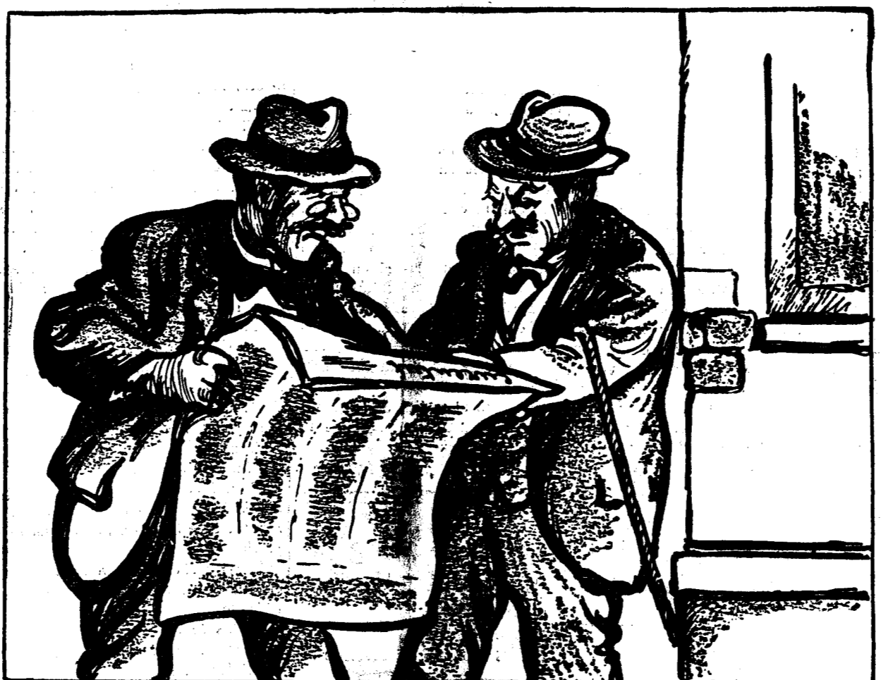
Mă rog și la ce o să servească acest „secretariat permanent al Micilor Intelegeri”?

Itată o persoană bine! Un domn care nu se poate plânge de lipsa de protecție! Oricum, această protecție trebuie să-l coste ceva.