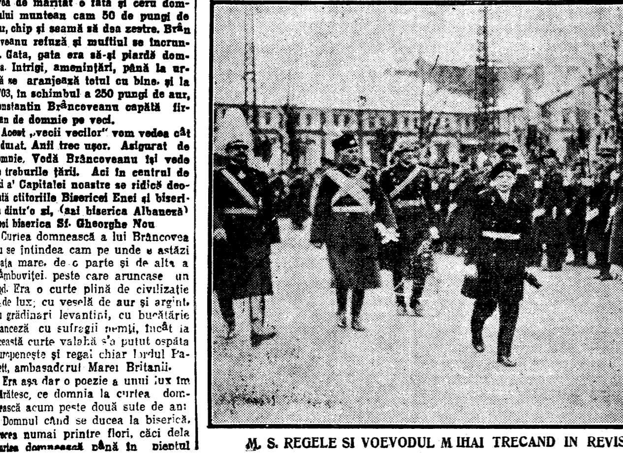
M. S. REGELE SI VOEVODUL MIHAI TRECAND IN REVISTA COMPANIA DE ELEVI