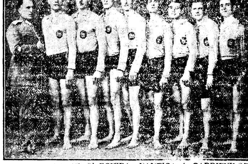
UN CAUCATORUL ȘI ECHIPA NAUTICA A GARDIENILOR

În ziua când am asistat la cursurile de educație fizică ale gardienilor, o parte din elevii d-lui Chiește se antrenau la jiu-jitsu, care este un sport prin excelență poliștilor. Am admirat pregătirea cărora din „eri, și cred că chiar profesorul Ishiguro, care a format primii elevi la noi, ar rămâne încântat de gardienii din școala Poliției din Capitală.