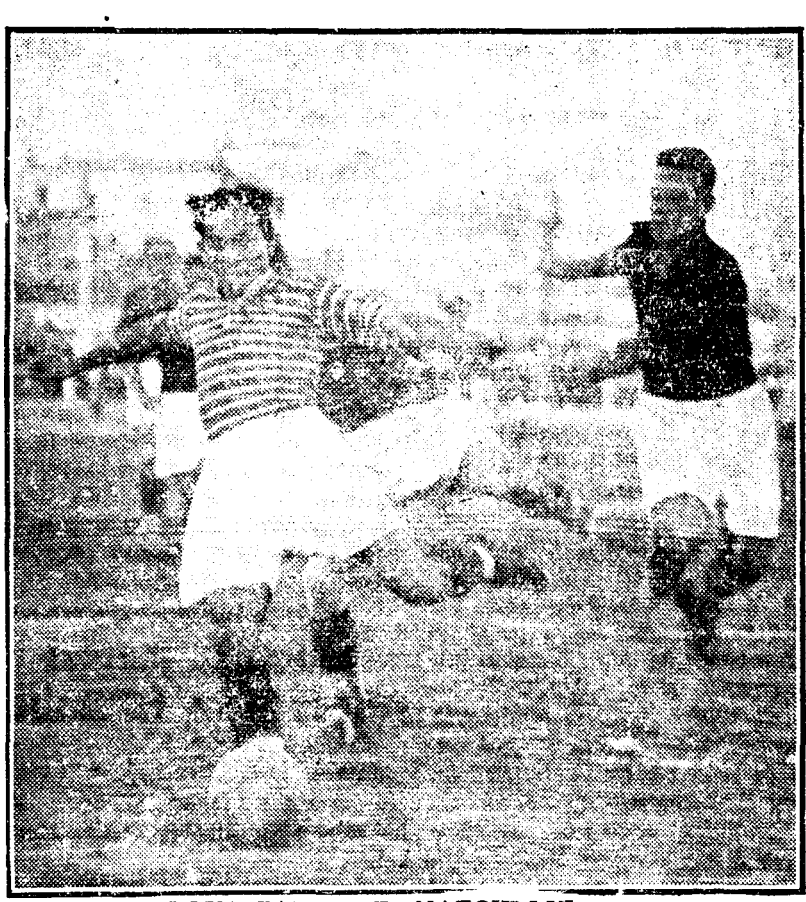
DOUA FAZE ALE MATCHULUI