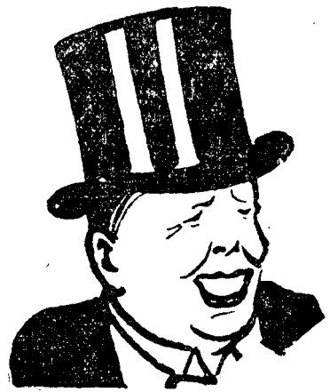
D. N. TITULESCU

Intr-o telegramă lungă mi-am repetat rugămintile făcute ta telefon, transmisă și prin d. Cădere. Ternimam telegrama prin cerearea, că spre a asigura libertatea de acțiune să-mi permită să rog