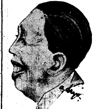
D. N. TITULESCU

„După planul elaborat la Atena... „După planul elaborat la Atena... „După planul elaborat la Atena...”