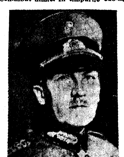
G-ral von Schleicher

Au fost răniți 20 de lucrători, dintre cari 3 sunt în înființeze o taxă asupra