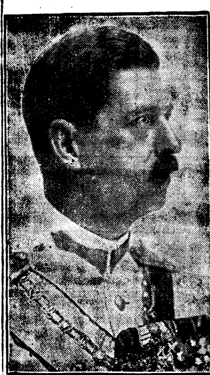
M. S. REGELE CAROL

În componența programului este că match-ul de foot-ball între echipele societății poliștilor din București și Cluj, a fost înlocuit cu match-ul Venus L. Juventus I.