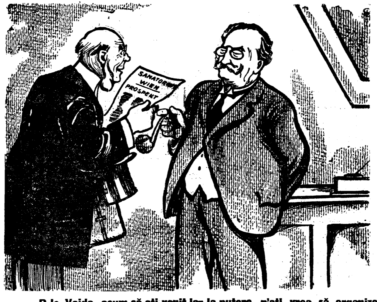
— D-le Vaida, acum că ai venit lar la putere, n'ai vrea să organizez un sanatoriu aici la București? Ca să nu se mai deranjeze domniile miniștri până la Viena, în caz de supărare...