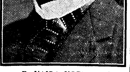
D. VAIDA VOEVOD

„Șefii partidelor fără excepție mi-au răspuns că nu văd un guvern de uniune națională decât prezidat de mine, dovadă de încredere pentru care am datoria să le aduc public mulțumirile mele cele mai sincere.