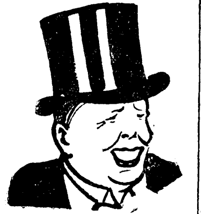
D. N. TITULESCU

Pentru o mai bună pricepere a celor întâmplate — atât de multe, de variate și surprinzătoare — în cursul zilei de ieri, vom aminti că Sâmbătă șară, apăsătoare, în chip neîndoios, eșua guvernul de mare concentrare, adică cu național-fărăneștii și cu liberalii ducști, așa cum îl dorea d. Titulescu.