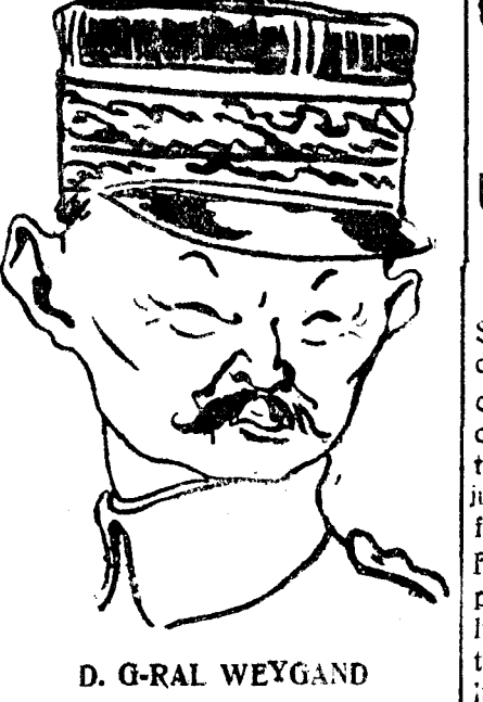
D. G-RAL WEYGAND

căruia în viața unui popor, la un proces de descompunere care bate recordul tuturor țărilor din lume. Pe când în restul lumii se evidențiază numai efectele unor împrejurări de ordin general, efectele unor transformări cari se petrec în viața economică de pretutindeni, la noi se evidențiază pe lângă aceste efecte în măsură incomparabil mai mare consecințele unor adevărate crime care s'a comis în politica noastră economică. Total ce s'a făcut dela unire încoace până astăzi sub acest aspect s'a făcut par'că anume ca să se distrugă vjaga și rezistența poporului român. Acel cari se șbat astăzi ca să pu-nă mâna pe putere să știe că noi debitorii orășeni am ajuns la ultima limită a răbdării noastre. Orcce vânzare silită ce se va face după constituirea noului guvern, noi o vom socoti ca o provocare la simțul nostru de conservare și vom răspunde la ea cu cea mai strâmică energie. Cerem suspendarea vânzărilor silită, cerem un egal tratament cu ceilalți cetățeni și cerem lichidarea legii de stabilizare, prin care s'a comis cea mai grozavă crimă față de cei cari reprezintă clasele producătoare ale acestei țări. Intrunirea a luat sfârșit la ora 2 anunțându-se o întrunire pentru ziua de Miercuri 8 Iunie ora 9 jum.