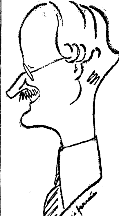
BRUXELLES, 29. (Radior). — Profesorul Piccard se pregătește pentru o nouă ascensiune în cursul lunii viitoare.