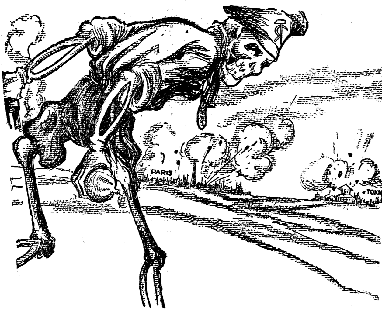
— Al cui e rândul? ..

Mistica rusească pare să-și identifice și să-și reveleze procedeele preferate și în asasinarea primului ministru Inukai, — doborât (este adevărat) de compatrioți, dar de