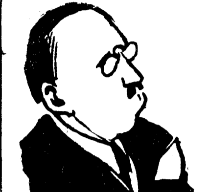
D. VIRGIL MADGEARU