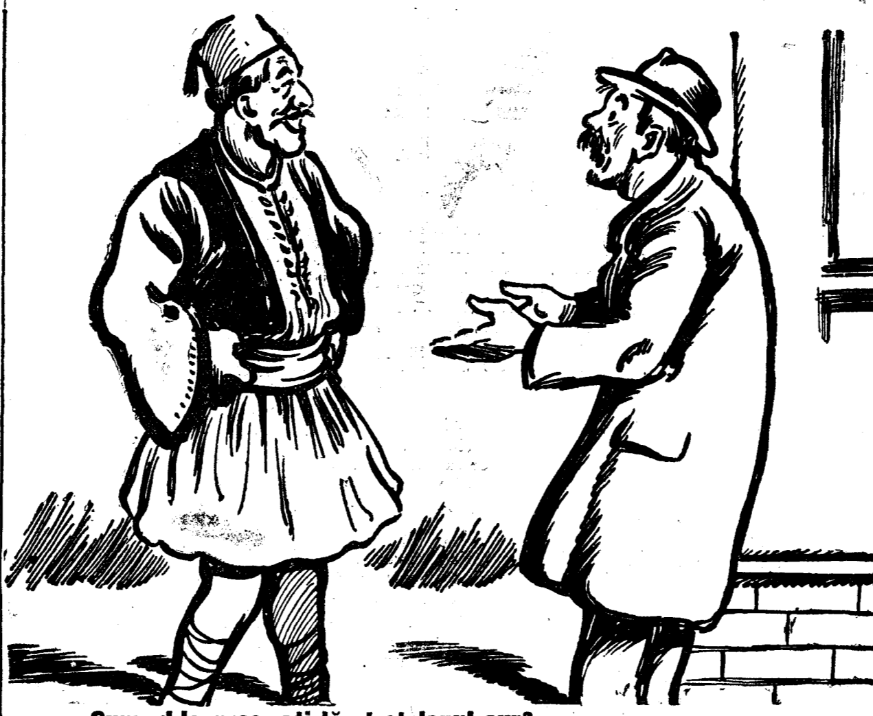
— Cum, d-le grec, ai lăsat etalonul aur? — Ei, l-am lăsat noi, ne-a mai lăsat el...