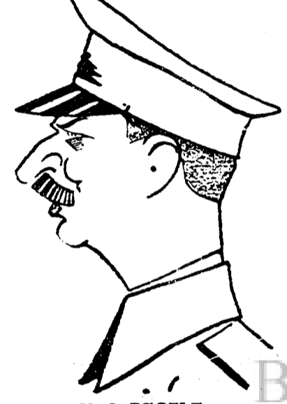
M. S. REGELE

BARLAD, 27. — Nenorocirea inundațiilor care a lovit populația nevoașă din diferitele regiuni ale țării, nu a trecut fără puternic răsunet în sufletul Suveranului. M. S. a pșnut ca imediat după restabilirea liniilor de comunicație, să meargă acolo unde valurile neștiutoare au distrus cămine hibrid înfiripate din muncă trudnică și lipsuri. Ei la Arad, astăzi la Bârlad, Regele țării a scoborât în mijlocul nevoiașilor, îmbrățindându-i cu vorba și împărțindu-le ajutoare pentru refacerea gospodăriilor imprăștiate. Măreșă și profund umana faptă a M. S. va dăinui în sulețele celor pe care i-a ajutat.