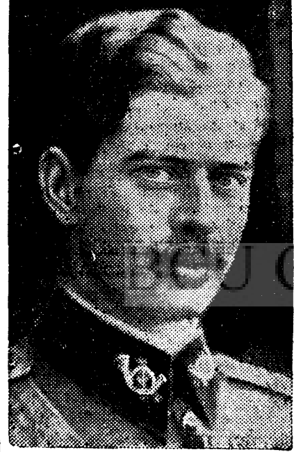
M. S. REGELE

Eri la orele 10 dimineața s'a întrunit la Palatul Regal din calea Victoriei, un consiliu de miniștri, sub președinția Suveranului.