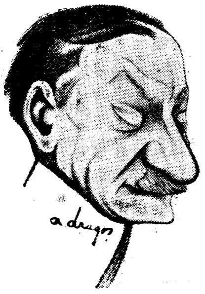
D. IULIU MANIU

În orice caz, manifestația făcută ministrului de Finanțe, la Cluj, este simptomele.