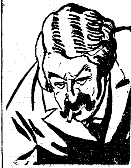
D. ARISTIDE BRIAND

LONDRA 15 (Rador). — Ziarele alți că manevrele flotei britanice vor avea loc anul acesta în regiunea insulelor Madere. La manevre vor lua parte 102 unități.