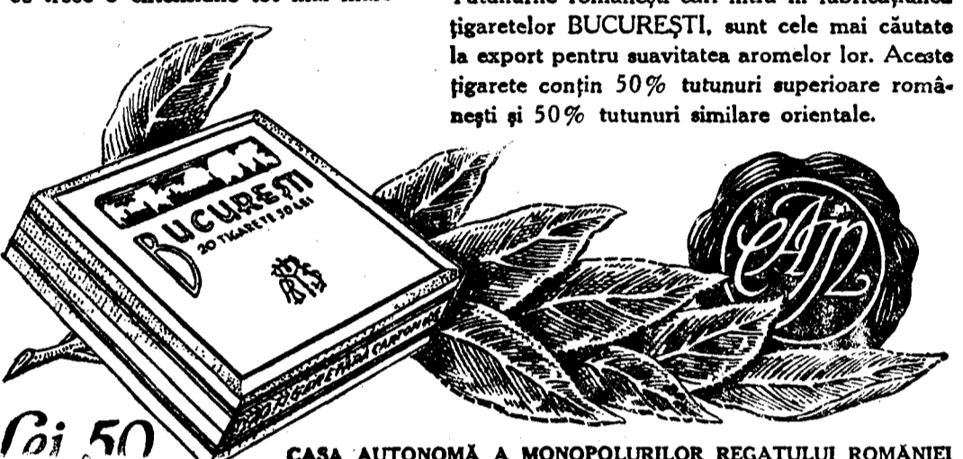
CASA AUTONOMĂ A MONOPOLURILOR REGATULUI ROMÂNIEI