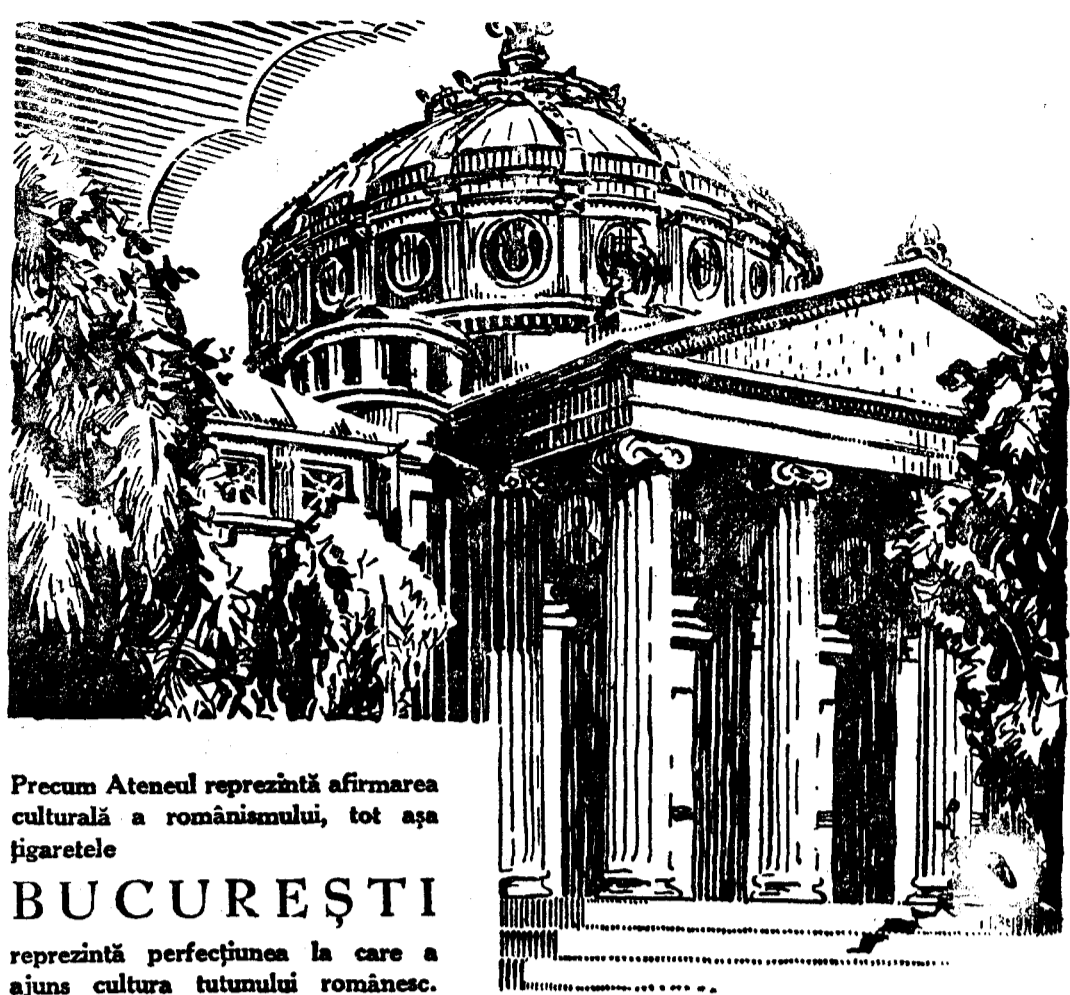
Precum Ateneul reprezintă afirmarea culturală a românismului, tot așa țigăretele BUCUREȘTI reprezintă perfecțiunea la care a ajuns cultura tutunului românesc.