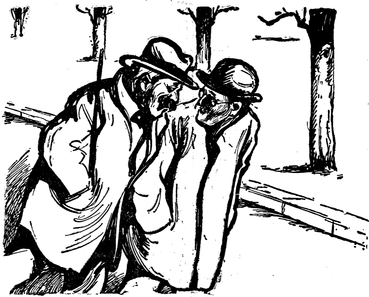
— Ei și-acuma, că ai rămas fără slujbă, ce te faci? — Ce să fac? Aștept și eu, să fie gata planul de refacere al guvernului...