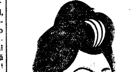
D. ION MIHALACHE

tidele de guvernământ. Dar în afară de această ambianță favorabilă propagandei sovietice, avem și împrejurări extrem de grele. Sărăcice multă și fără semn de izbăvire, țigănie politică tot atât de multă, — iar vrăci vieții noastre economice își prezintă descăntecele sub forma de planuri grozave. Pe urma acestor planuri marelte, întovărășite de toată elocința generoasă a acestor asiguratorii de fericire obștească, nu a păsit acțiunea întâmplătoare, urmând ca