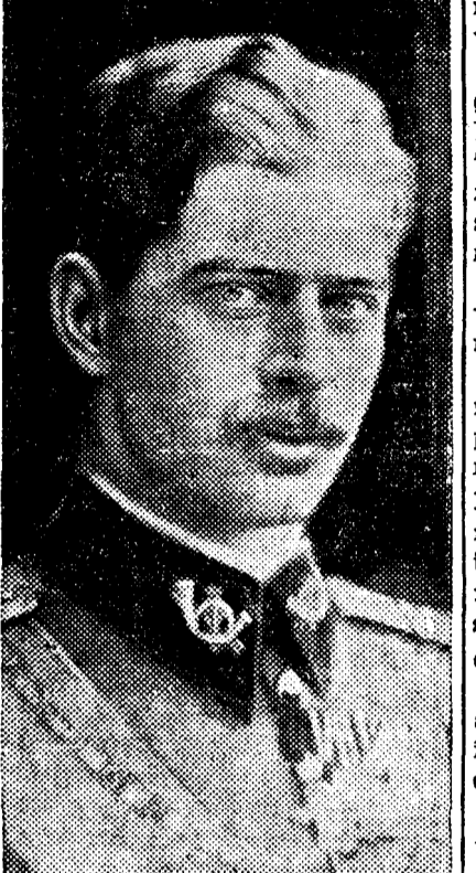
M. S. REGELE CAROL

mat să se ocupe de situațiunea generală a țării și să afirme punctul de vedere al partidului național-liberal în soluționarea acestei situațiuni și a problemelor ce sunt astăzi la ordinea zilei.