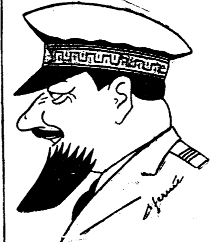
D. GENERAL BALBO