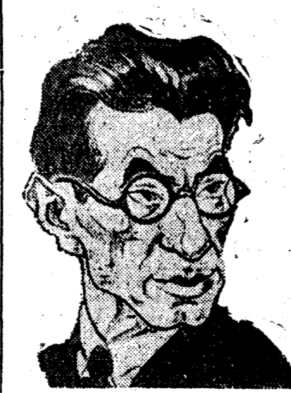
PANA IT ISTRATI