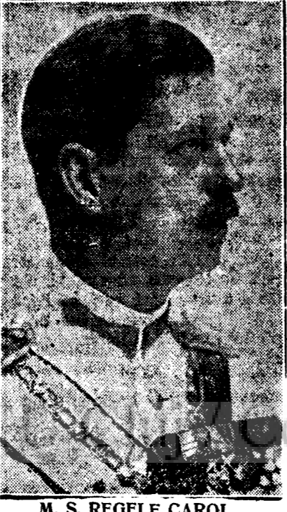
M. S. REGELE CAROL

Noi suntem deifinitiv legați de pământ, căci purtăm haia de piugă și strămoșii și legea conversiunii datoriilor agricole, este primul pas spre demitizarea care ne-a stăpânit. Dar inițiativa acestei mari reforme, a conversiunii datoriilor agricole îi revine în întregime M. S. Regelui Carol II. (Asistența în picioare aclamă timp de câteva minute pe Suveranul).