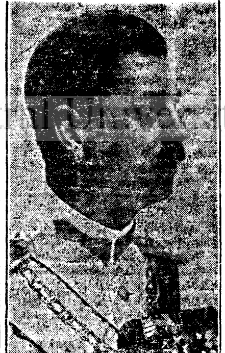
M. S. REGELE CAROL II

Eri dimineață la ora 11 a avut loc în amfiteatrul „Fundatiile Carol I” sărbătorirea centenarului „Inducției” și a memoriei lui Faraday.