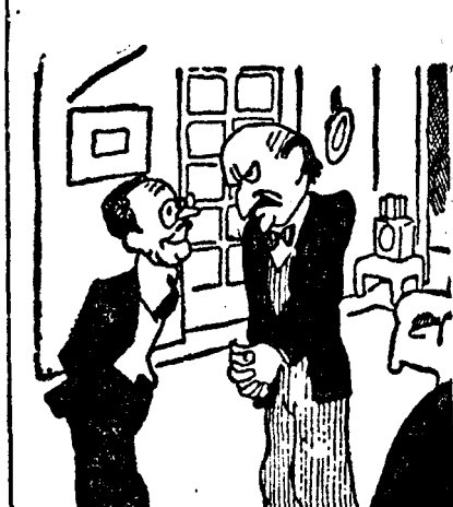
— Pe Dumneata nu te impresio- nează, spune, stăta carne de tun cât se mistuie în Mancușia?... — Cum vrei să mă impresioneze?... Știi doar foarte bine că sunt vege- tarian...

Totuși, la pauză, Topinant observă: — Fără cele două idiote ale tale, am conduce acum cu 1 la 0... Îi luai deoparte, și-ți explicai că Ga- briella era probabil cauză declinului