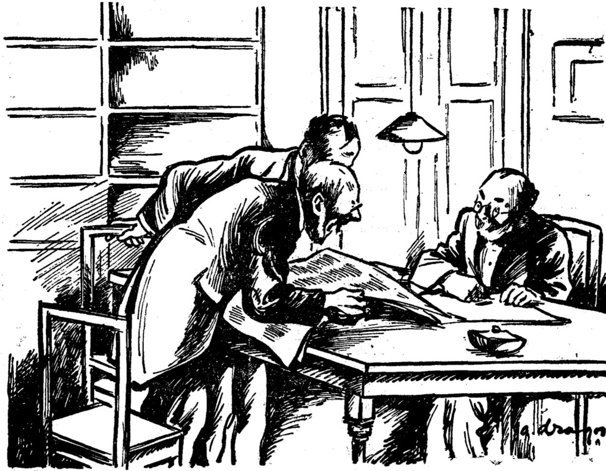
I-auzi, bre, cică d. prim-ministru dăruiește Universităților, bugetul Președinției. Păi noi, funcționarii dela Președinție, ce ne facem? De unde mai luăm leață? Lasă, domnule că are d. prim-ministru grijă la urma urmei, ne face și pe noi cadou cuiva...