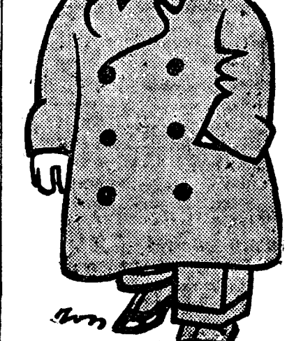
D. C. ARGETOIANU

căm mai puțin, aducând cât mai puțin de dezorganizare? Cu alte cuvinte cari sunt acele ramuri ale vieții noastre, care deși lovite la un moment dat ar reuși peste câteva timp o viață normală? Se poate să mă fi înșelat, se poate că discutând aici în comisia bugetară, să mi se aducă argumente că s'ar putea face anumite schimbări în repartitia săraciei în bugetul meu! Asupra acestei chestiuni, asupra căreia voi reveni mai târziu, nu insist. Insist deocamdată asupra cifrei globale a bugetului, și vă spun, peste această cifră nu pot să trec: fiindcă nu va fi depășită de încasări, și pentru că nu mă mai pot prezenta în bugetul anului 1932 cu niciun deficit.