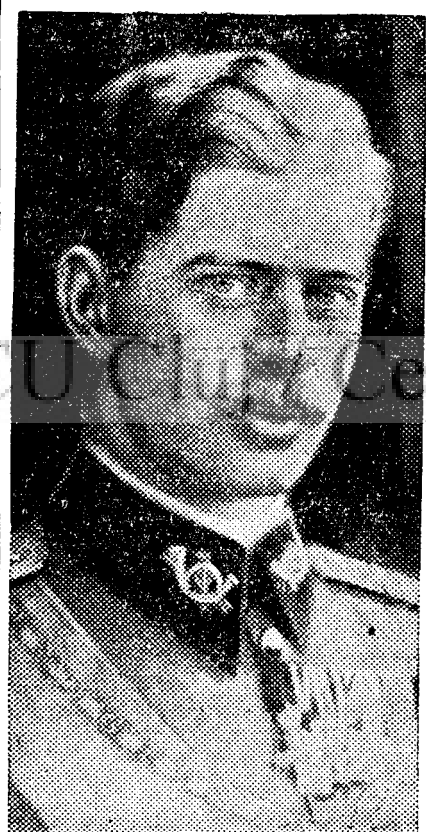
M. S. REGELE CAROL II

Vă pot afirma, domnule Președinte al Consiliului, că gândul și sufletul Meu va fi în mijlocul reprezentanților Națiunii, în momen-