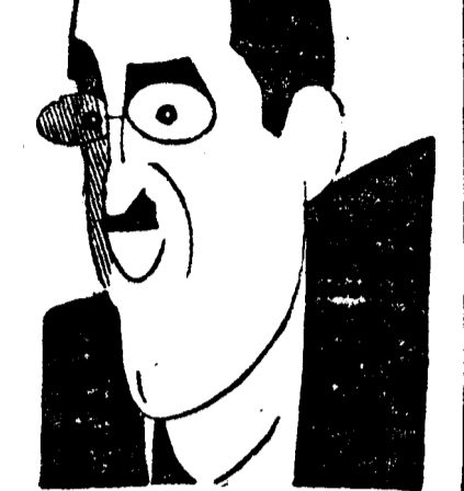
D. VIRGIL MADGEARU

Când eram ministru de finanțe am găsit într'un an numai în Capitală 50.000 de cetățeni cari se sustrăgeau metodele dela plata impozitelor.