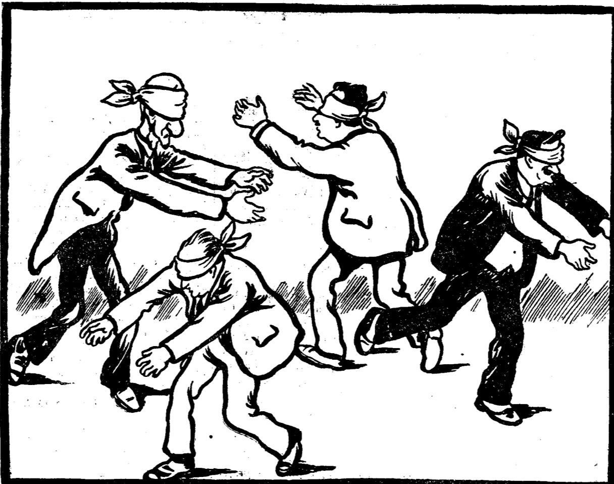
SPRE REGRUPAREA FORTELOR POLITICE.