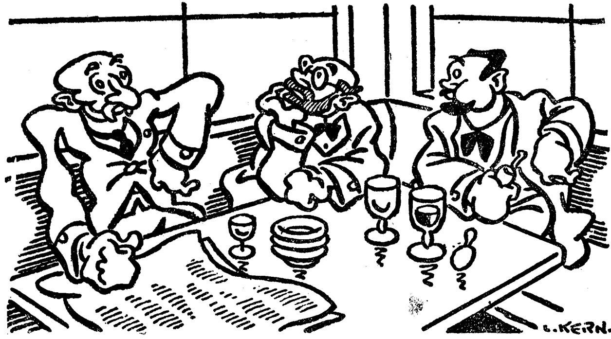
— Cum erau să mai evite Englezii criza, dacă și-au redus mereu orele de lucru în uzine, și continuă să consume ca în vremurile bune?...