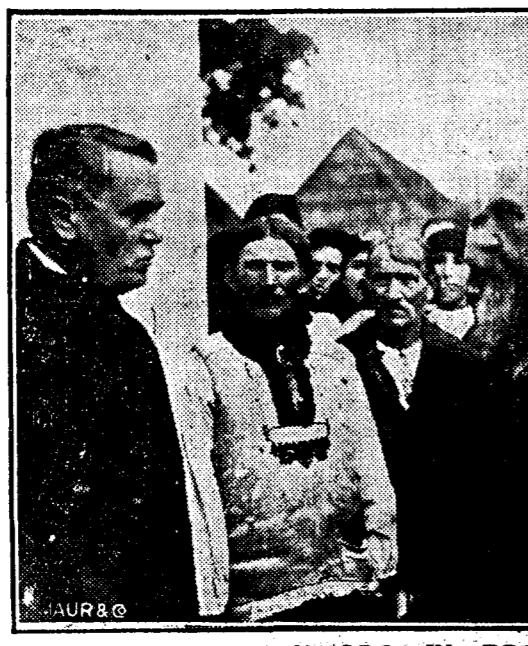
D. N. IORGA ÎN ARDEAL

mâne, și datoria să urmezi până la ultima clipă a vieții sfârșitului, a-Postolatul din care s'a fost făcută viața. Vei merge atâta vreme cât picioarele bătrâne te vor mai putea sprijini, atâta vreme cât cuvintele nu vor muci pe buzele sfârșite tale, vei merge și vei spune pretutindeni, cu zilele de muncă și de credință pe care le-ai trăit, că numai în acest fel, și nu prin mizerabile întreceri dintre foloșose personale, sau de grupări, fara aceasta va rămâne, cum este dreptul lui, în starea în care ne-a ajutat Dumnezeu să o aducem”. Impotriva regionalismului ardelenesc În continuarea discursului său dela Târgul Mureș, care e o sinteză de tot ceace d. Prim-ministru a vorbit în aceeași zi, prin sate, sătenilor, învățătorilor și preoților, d. N. Iorga a