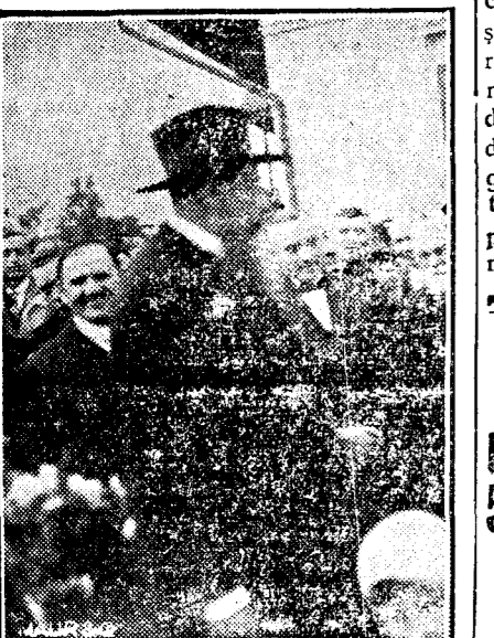
D. N. IORGA VORBIND TĂRANILOR DIN HODAC