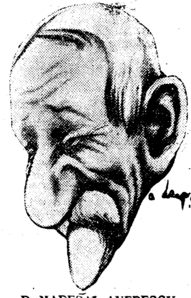
D. MAREȘAL AVERESCU