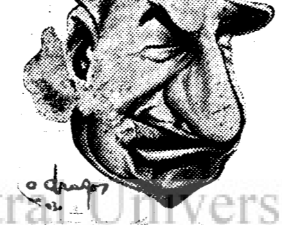
D. CONST. ARGETOIANU

D. Iorga, președintele consiliului de sus astăzi în Capitală, și d. C. Argetoianu, ministru de finanțe se reînvoarcă tot astăzi în Capitală unde va rămâne în tot cursul săptămînei și va lucra cu membrii