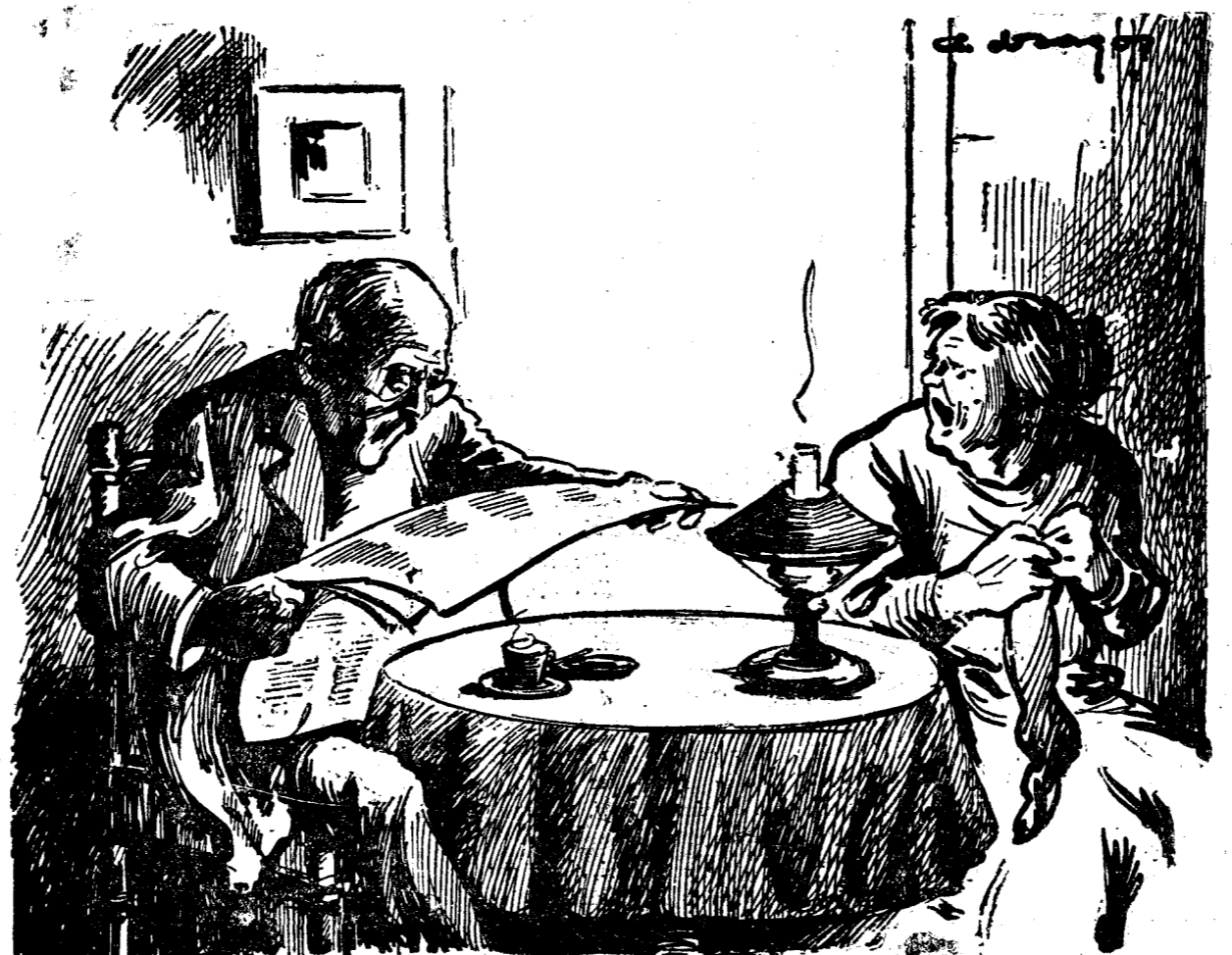
— Trecu vara, nevastă, și n'apucaram să mergem și noi măcar o Duminică la Sinaia!... — Asta ne mai lipsea!... Să spună vecinii că umbliam să vărăm intrigi în guvern?!