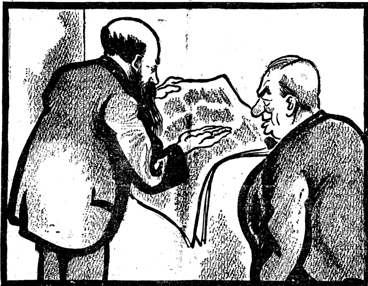
D. IORGA: Ai văzut că d. Duca cere guvernul, cu condiția să se revizuiască Constituția. D. ARGETOIANU: E un naiv! Totul e să te simți întâi la guvern și că pe urmă, Constituția se revizuieste dela sine...