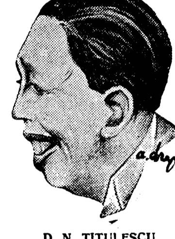
D. N. TITULESCU

Este în tradiție, Societății Națiunilor — așa cum relevă și telegramele, pe care le publicăm mai jos, — ca un președinte, al cărui mandat anual expiră, să nu mai fie reales. Pentru prima oară, în actuala sesiune, această tradiție a fost călcată, d. N. Titulescu fiind reales președinte al Adunării, în urma stăruințelor mal multor delegațiunilor în frunte cu delegațiunea britanică și împotriva rezervei d-lui Titulescu, care ar fi dorit să nu se producă nici o abatere dela linia tradițională a Ligii Națiunilor. Pentru țara noastră, re alegerea d-lui Titulescu și încă prin căderea delegațiunilor maghiar contele Apponyi înseamnă un succes diplomatic, care merită o excepțională subliniere. Acest succes înseamnă o onoare deosebită, care se face României, dar în același timp și un omagiu considerabil prestigium d-lui Titulescu peste hotare. Este îmbucurător că, de astădată cel puțin, propaganda revizionistă, care desigur că n'a lipsit să se producă în jurul candidaturii contelui Apponyi, a primit din partea celui mai înalt for internațional un răspuns atât de drastic și prompt.