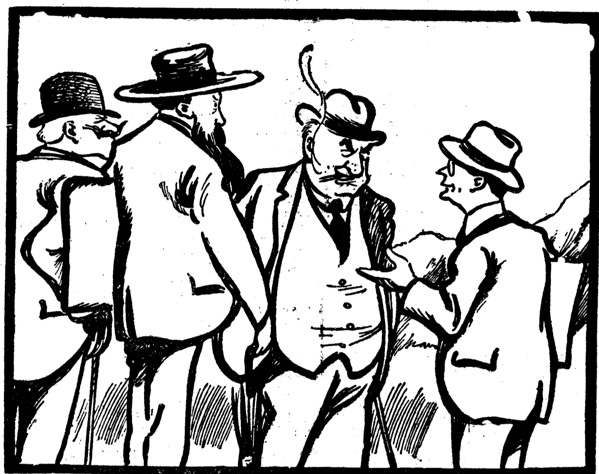
— Viitorul consiliu de miniștri unde-l ținem? — Nu se știe încă precis. Sau la Peștera Dâmbovițoarei sau în Insula Șerpilor...