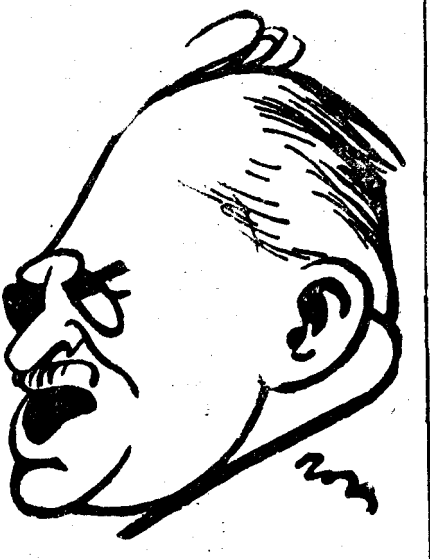
D. I. G. DUCA

De acia regret că guvernul nu a voit să fie seama de soluțiile preconizate de partidul nostru în chestiunea valorificării cerealelor, soluții uni practicele cu succes în alte țări, ci s'a optit la formule care de acum s'au arătat neputincioase să rezolve această chestie de care depinde întreaga soartă a agriculturii noastre. Cât despre atitudinea, pe care partidul național-liberal va lua-o la toamnă, cred că m'am rostit destul de lămurit în cuvântările mele anterioare. „Partidul nostru înțelege și duce o acțiune de opoziție a cărei intensitate și ritm le vor dicta în primul rând faptele guvernului. Stă în tradiția partidului național-liberal să acorde un credit oricărui nou guvern și cineva trebuie să fie lipsit de simțul răspunderii și să ignoreze prea mult complexul problemelor ce frământă astăzi omenirea pentru ca să se menție în vechiul tipic al opozițiilor și al luptelor de partid. Dar cu atât mai mult se impune o atență și obiectivă supraveghere a acțiunilor guvernului și o luptă hotărâtă de a-l opri să agraveze prin greseliile lui greutatea situației”. RETRAGEREA D-LUI MANIU — Ce credeți despre retragerea d-lui Iuliu Maniu dela șefia partidului național-liberal? — „Văd din ziare că d-sa va rețua în curând conducerea partidului național-liberal. Mă bucură, dar nu mă miră. Mă bucură fiindcă este singura soluție liresculă, nu mă miră fiindcă n'am crezut niciodată în seriozitatea acestei retrageri. Am privit-o necontenit ca o manevră tactică. De altfel