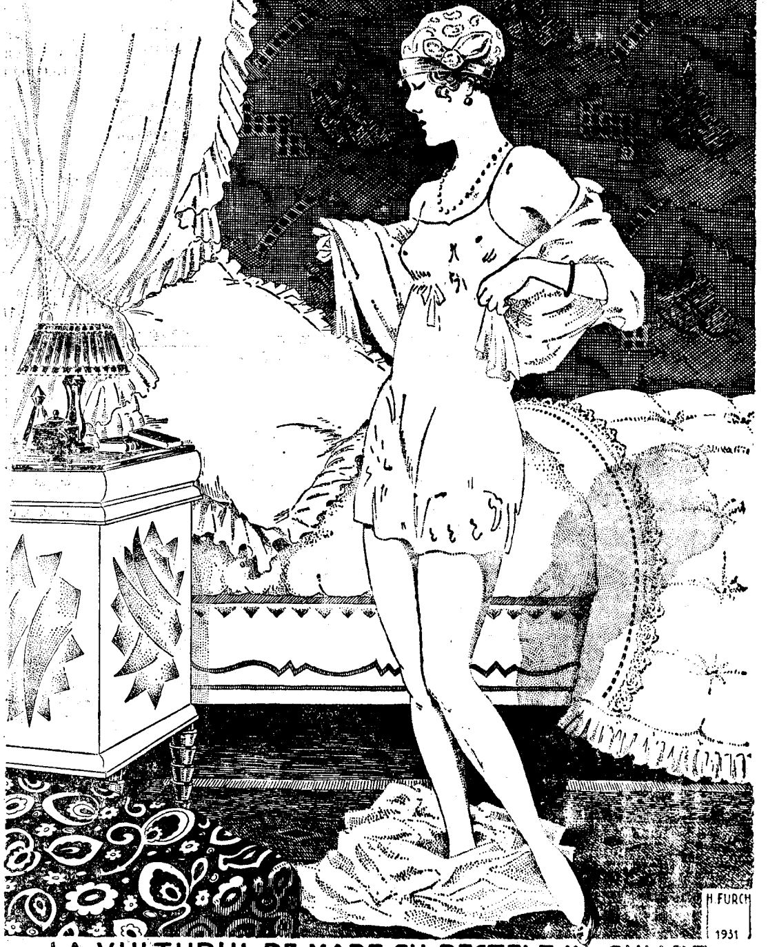
LA VULTURUL DE MARE CU PEȘTELE ÎN GHIAŢE.