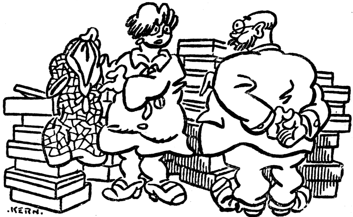
— Bine, dar ți-ai comandat și săptămâna trecută o rochie pentru plajă!... — Asta nu-i de plajă, asta-i rochie de inec... Un model special, lansat de o mare casă americană... Se poartă foarte mult vara asta!...