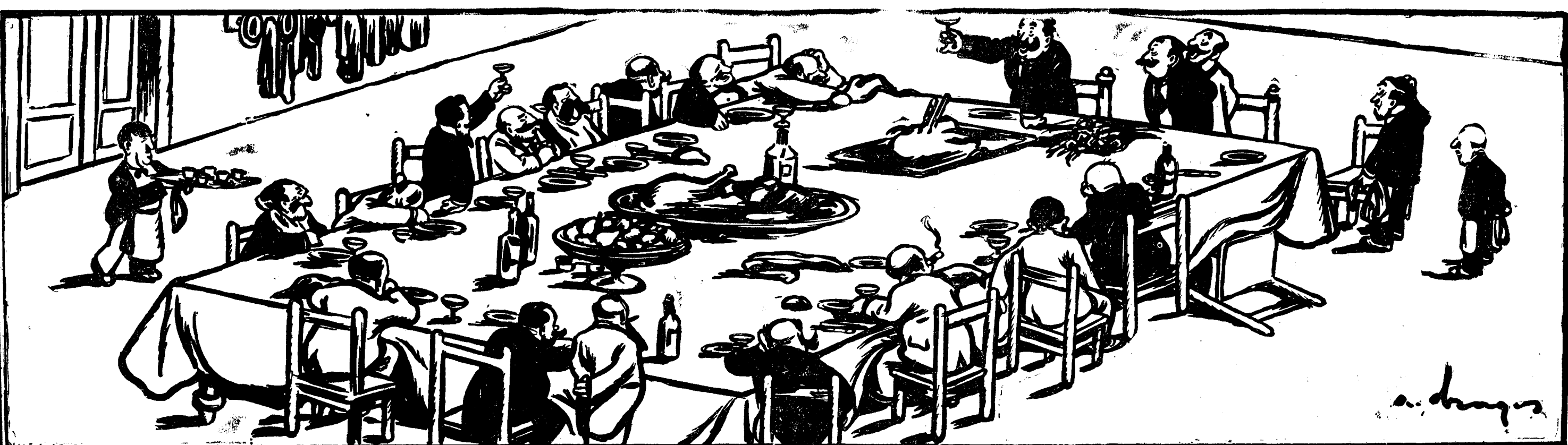
SUB REGIMUL ACTUALEI LEGI ELECTORALE NOUL DEPUTAT: Vă mulțumesc, cetățeni ai Carasului, că, prin voturile voastre, m'ați trimis ca reprezentant al Ialomiței în Parlament.