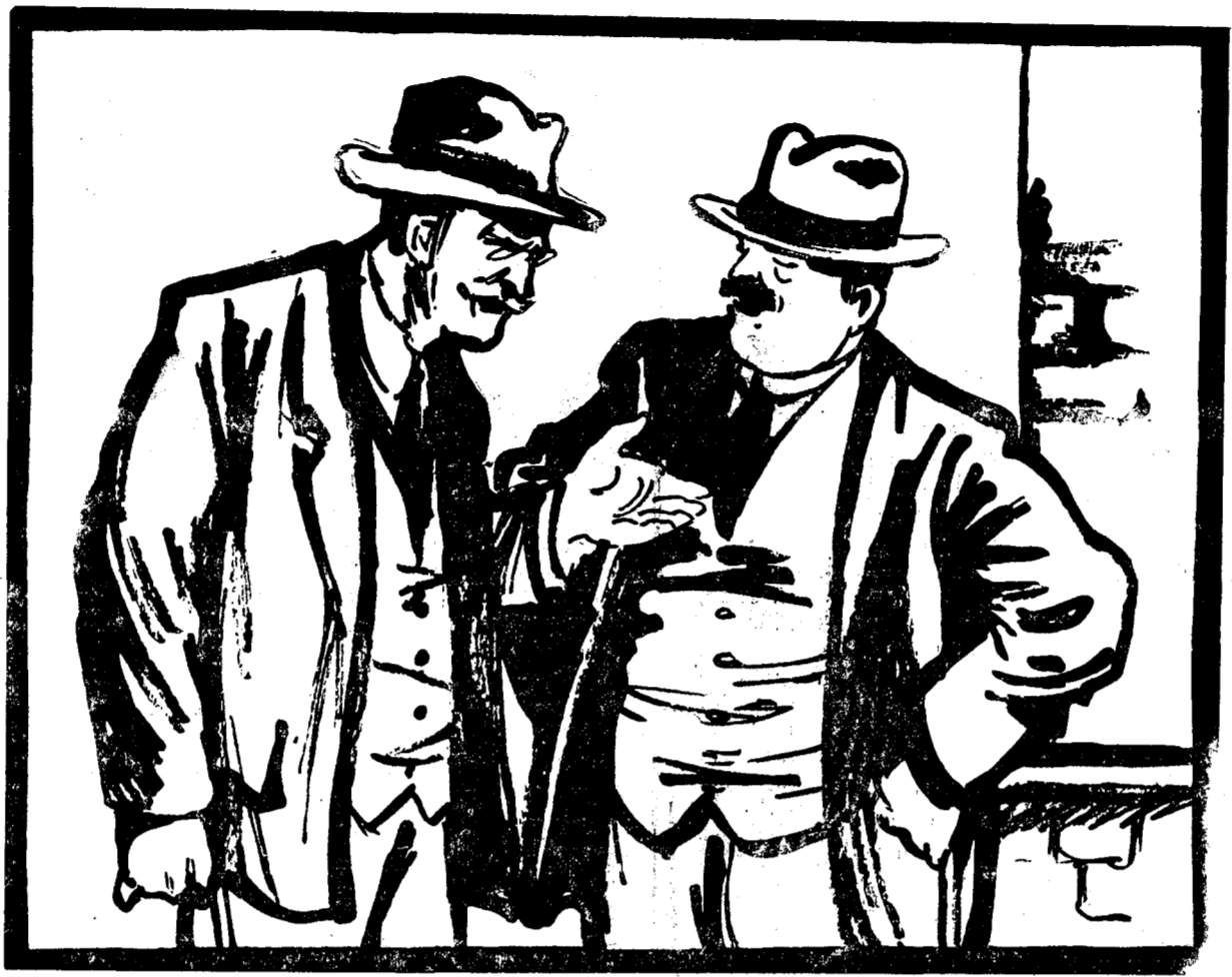
— Vrea să zică și tu candidezi? Bravo! Când pleci în propagandă electorală? — Cum o să plec, dragă? Am nevastă și copii...